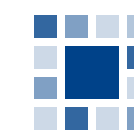
Curium-LUMC voor onderwijs en onderzoek