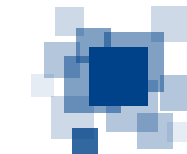
Curium-LUMC als behandelcentrum